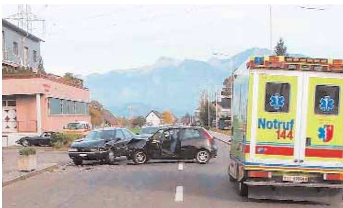
Die Insassen der verunfallten Autos in Siebnen erlitten leichte Verletzungen.

Siebnen. – Am Sonntag bog eine 21-jährige PW-Lenkerin auf der Glarnerstrasse in Siebnen links ab. Dabei kam es zur seitlich-frontalen Kollision mit einem Personenwagen auf der Gegenfahrbahn. Die Unfallverursacherin und die 74-jährige Beifahrerin im entgegen-